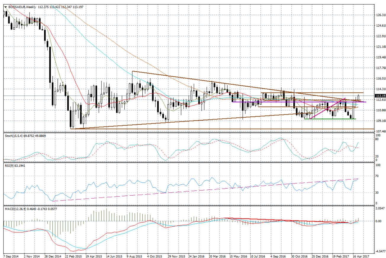
Wykres tygodniowy BOSSA EUR