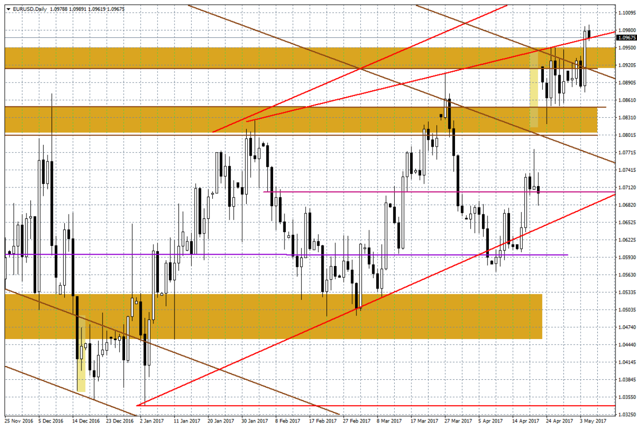
Wykres dzienny EUR/USD